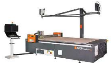
高速ガスケット加工機